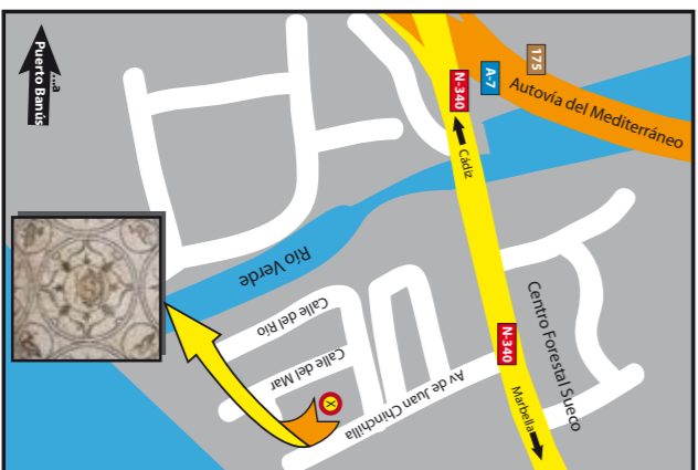
Villa Romana de Rio Verde

Villa Romana de Rio Verde. CN - 340, Km 176. Urb. Rio Verde Playa Termas Romanas de las Bovedas. A-7, Km 170. Urb. Guadamina Baja. San Pedro Alcántara Basilica Paleocristiana de Vega del Mar. A-7, Km 171. Urb. Linda Vista Playa. San Pedro Alcántara